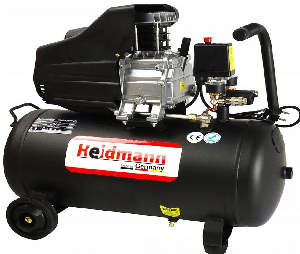
OLJEKOMPRESSOR KOMPRESSOR 50L 8bar HEIDMANN H00721

MODERN kompressor med hög effekt och luftkapacitet ökat till 220 l / min , varför den används i hemverkstäder och i professionella bilverkstäder för service av pneumatiska enheter.